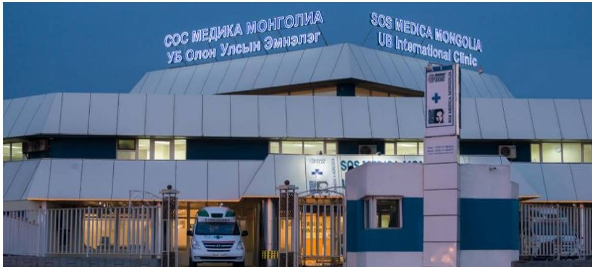
Зураг 2. СОС Медика Монголиа – төв байр.