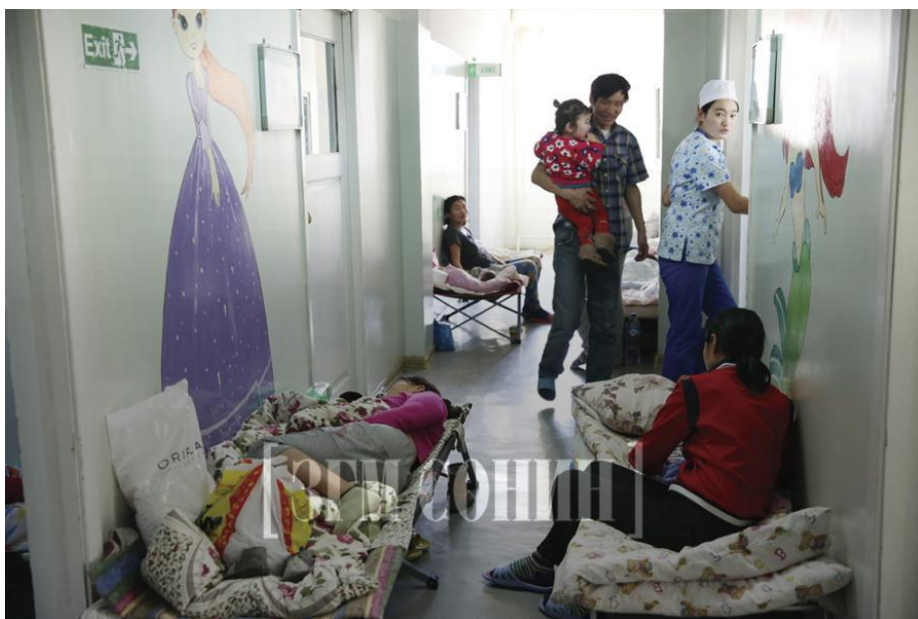
Зураг 2. Хүүхдийн эмнэлгийн ор хүрэлцэхгүй, эхчүүд, хүүхдүүд эмнэлгийн коридорт газар унтаж эмчлүүлэх явдал дор хаяад арван жил үргэлжиллээ. Энэ зургийг 2020 оны 1 дүгээр сард Засгийн газрын мэдээ сонинд хэвлэгдсэн нийтлэлээс авав. 31

СОС Медика Монголиа – 2000-аад оны эхээр уул уурхайн томоохон компаниуд Монголд үйл ажиллагаагаа эхлүүлэхэд, дипломат байгууллагууд ба олон улын санхүүгийн байгууллагуудын дэмжлэгтэйгээр тэдгээрт үйлчлэх зорилготой байгуулагдсан анхны хувийн эмнэлгүүдийн нэг. СОС Медика Монголиа нь Улаанбаатар хотын чинээлэг дүргүүдэд байрлах хэд хэдэн салбартай бөгөөд тэдний үйлчлүүлэгч уул уурхайн нөлөөлөлд өртсөн нутгийн иргэдийн эрүүл мэндийг хамгаалах ямар ч үүрэг хариуцлага хүлээдэггүй. Жигээлбэл, СОС Медика Монголиагийн эвакуацийн үйлчилгээ нь зөвхөн нийслэлд үзүүлдэг нарийн мэргэжлийн эмнэлгийн туслалцааг яаралтай авах шаардлагатай жирэмсэн малчин эмэгтэйчүүдэд хүртээмжгүй. Эрүүл мэндийн хүнд байдалтай эмэгтэйчүүд Гурвантэс, Ханбогд, Улаанбадрах зэрэг сумдаас Улаанбаатар хот руу машинаар нэг талдаа 500 – 780 км явж хүрдэг.